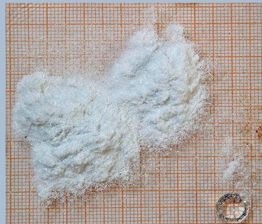
Гримуча ртуть \text{HgO}_2\text{N}_2\text{C}_2