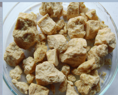
Тротил (ТНТ) \text{C}_7\text{H}_5\text{N}_3\text{O}_6