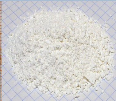
Азид свинцю \text{Pb}(\text{N}_3)_2