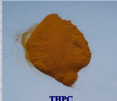
ТНРС (Тринітрорезорцинат свинцю) \text{C}_6\text{H}(\text{NO}_2)_3\text{O}_2\text{Pb}