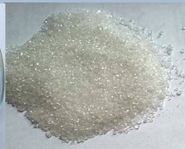
Гексоген (RDX) \text{C}_3\text{H}_6\text{O}_6\text{N}_6