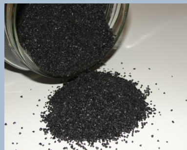
ДРП Димний рушничний порох