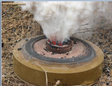
УДШ інженерна міна – Димова суміш