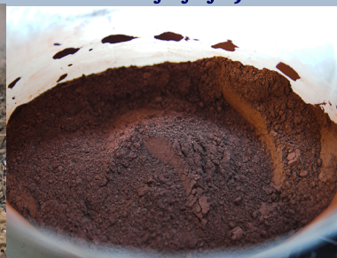
Терміт \text{Al} і \text{Fe}_2\text{O}_3 (1:3) Запалювальна суміш