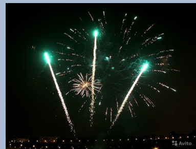
Висотні феєрверки – салют