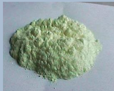
Пікринова кислота \text{C}_6\text{H}_2(\text{NO}_2)_3\text{O}_2\text{OH}